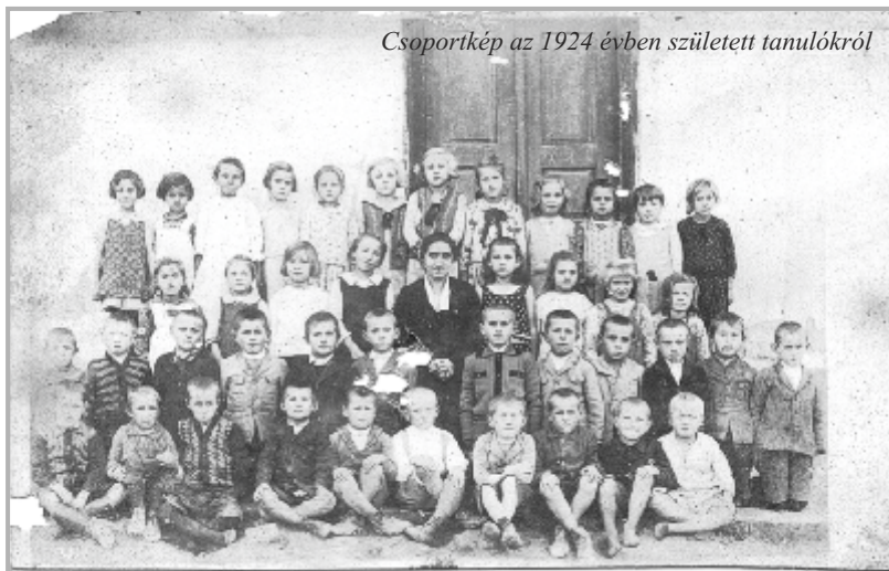
Csoportkép az 1924 évben született tanulókról